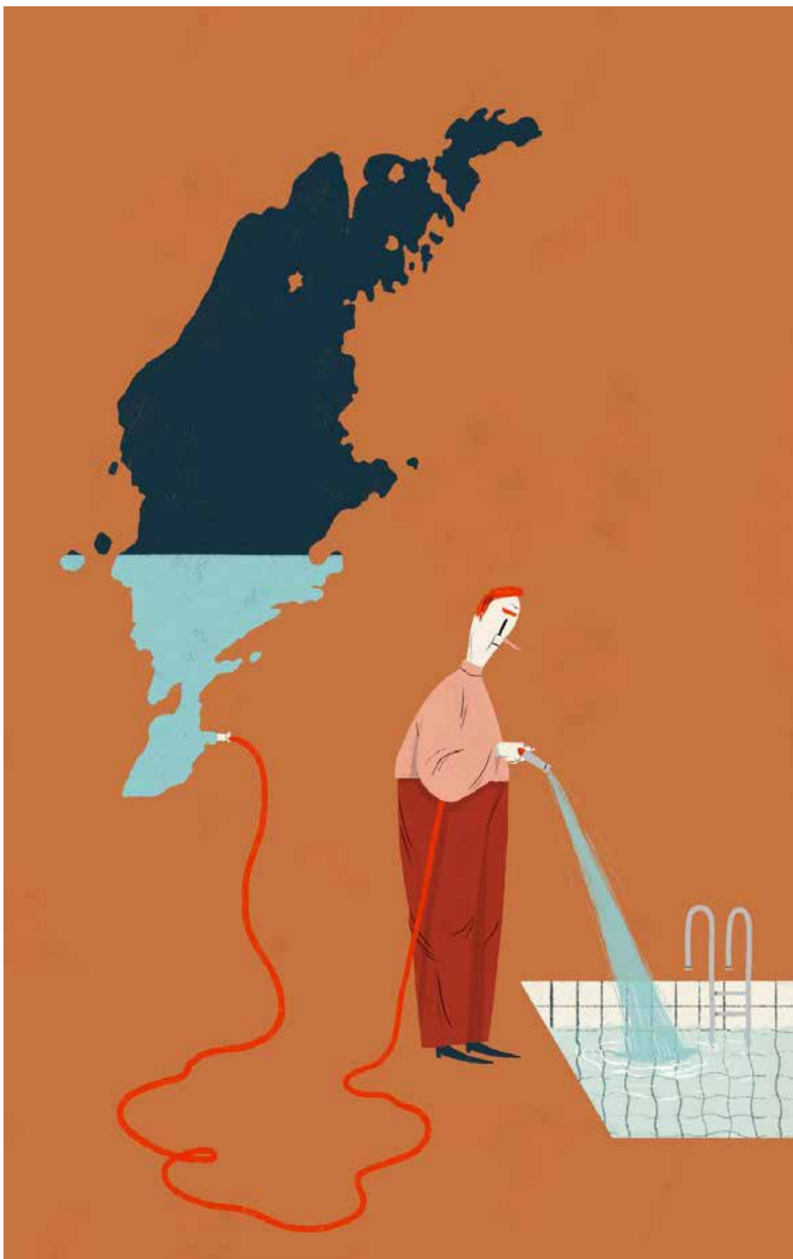
EMMA HANQUIST REFLEKTERAR ILLUSTRATION AV EMMA HANQUIST (2022)