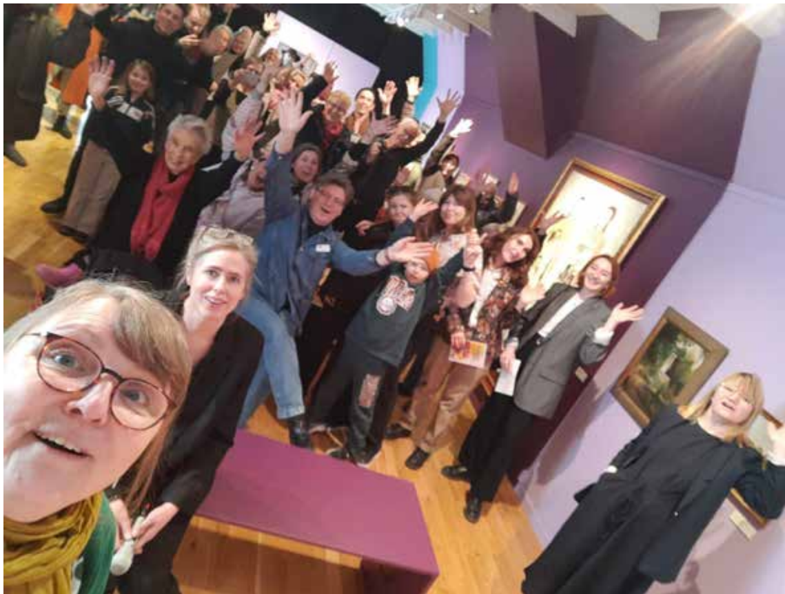
GRUPPBILD (WEFIE) FRÅN VERNISSAGE AV KONSTLIVET (2023)

Museet är en attraktiv mötesplats där man vill tillbringa tid och hänga på. Dit man kommer för en utställning, ett samtal, en visning, workshop, eller för att mötas. Här pågår alltifrån konstnärspresentationer, filmvisningar och konstboks-releaser, till fortbildningar och workshops. Museet sänker trösklarna till institutionen genom programverksamhet som gör lokalsamhället delaktigt samtidigt som man värnar om kvaliteten gällande utställningarna. Det lokala konstlivet engageras genom programverksamhet och nätverksträffar. Likaså genom initiativ som Open Calls och juryuttagna utställningar.