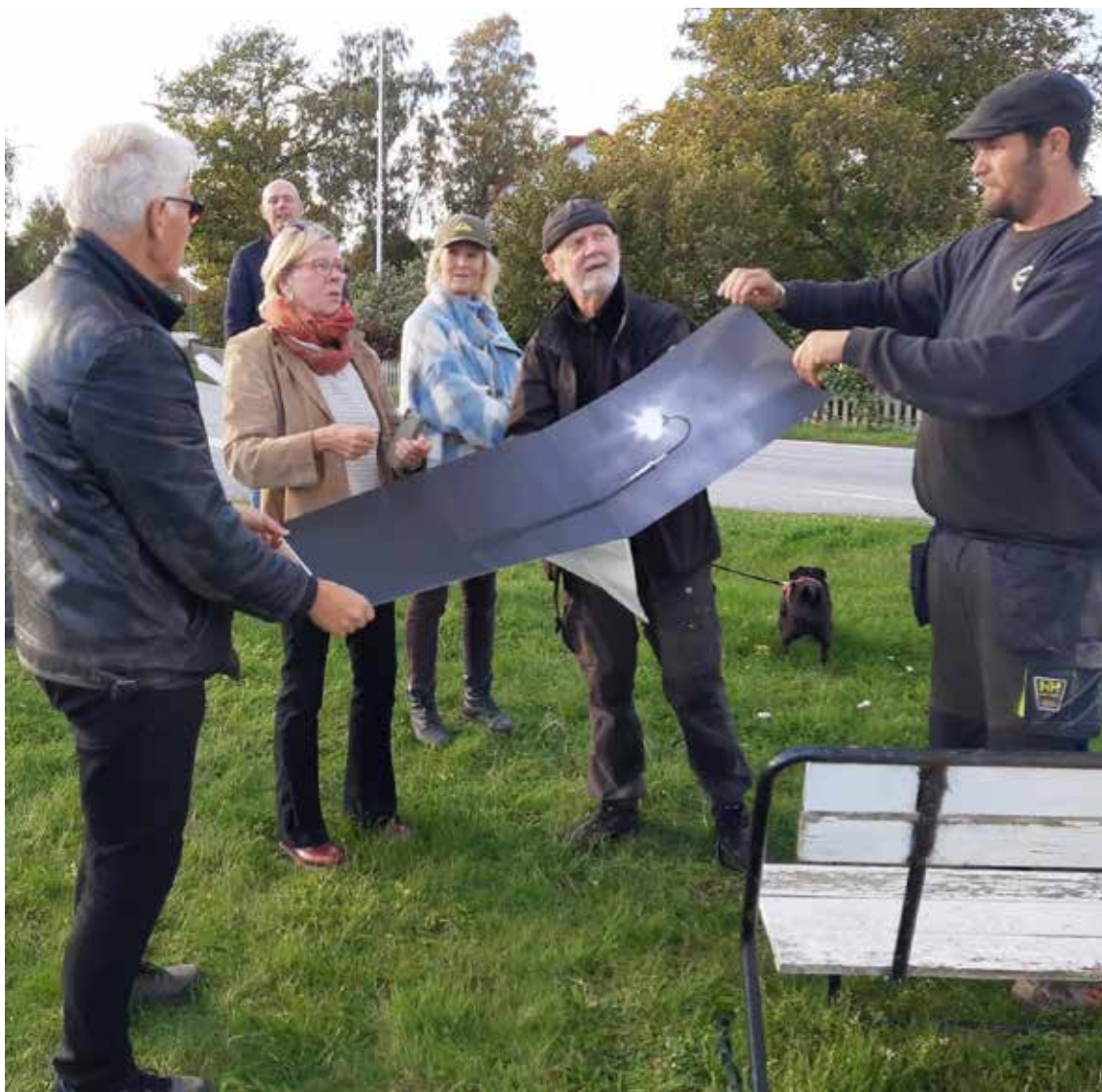
INSTALLERINGSBILD PROJEKT FEJS & PLEJS (2022) AV TOMMY SÖDERLUND OCH CARINA JOHANSSON

Gotlands Konstmuseum utvecklar samarbeten och långsiktiga relationer med andra konstinstitutioner och konstaktörer regionalt, nationellt och internationellt. Konstmuseet knyter an till nya nätverk som är inriktade på samtidskonst och samtida visuell kultur. Museet samarbetar med skolor, universitet och andra utbildningar samt med civilsamhälle, näringsliv och besöksnäring. Gotlands Konstmuseum samarbetar och ingår i arbetet med resurscentret Konst och Form på Gotland , vilket innefattar att utveckla en plattform för konstens aktörer och intressenter på ön.