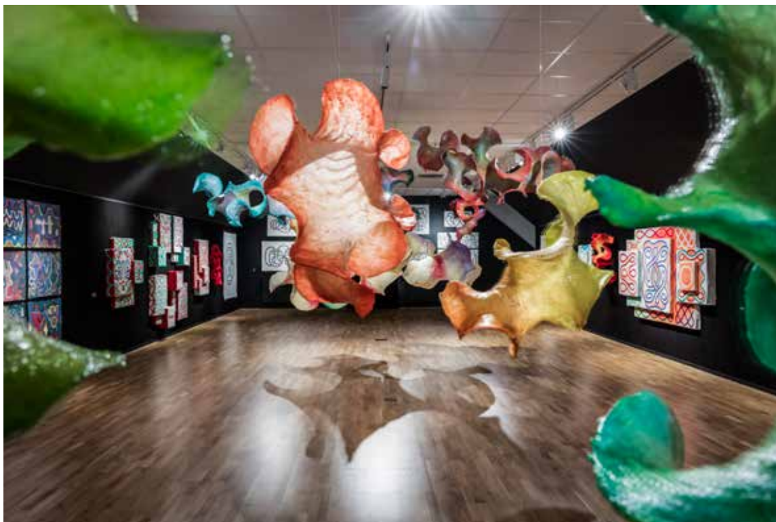
ÖVERSIKTSBILD AV UTSTÄLLNINGEN BÄRVÅG AV MATTI KALLIOINEN. (2023)