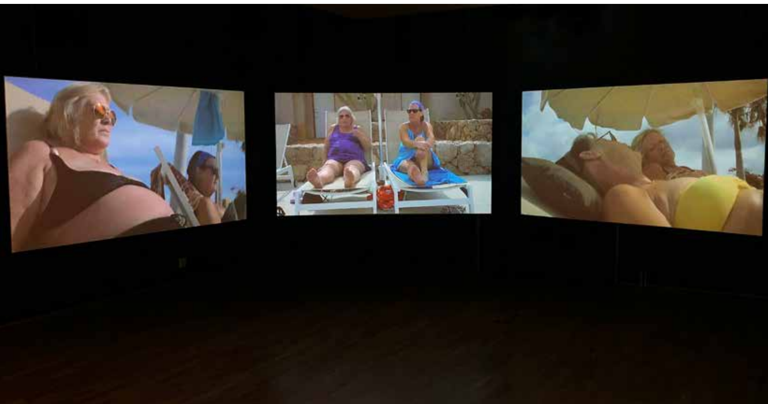
INA PORSELIUS ALLTING GÅR ÖVER OM MAN BLUNDAR (2017) VIDEOINSTALLATIONEN INGICK I UTSTÄLLNINGEN LEVA LIVET .

Att museet har ett gott samarbete med konstnären är av stor vikt. Tillsammans med konstnärer och andra aktörer undersöker och följer Konstmuseet konstens och utställningsmediets potential och möjligheter.