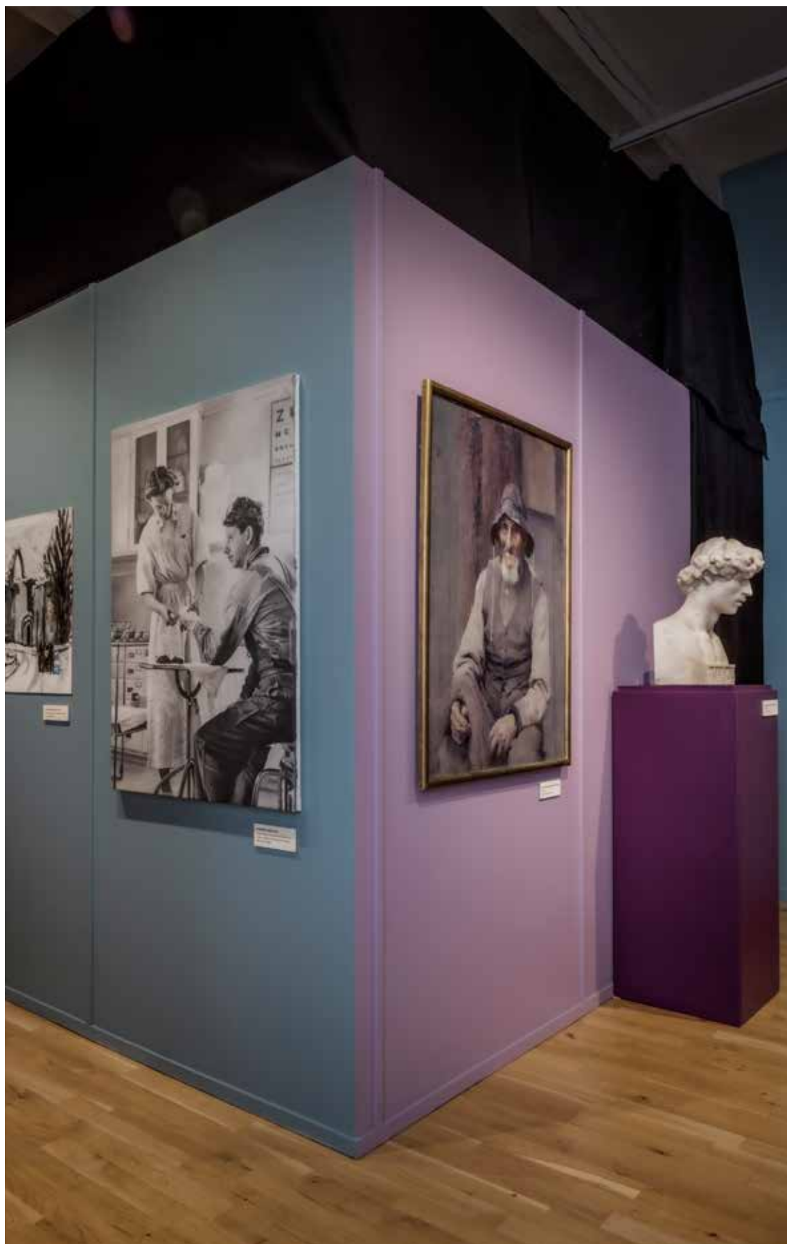
UTSTÄLLNINGEN KONSTLIVET TORBJÖRN LIME STENARBETAREN SUNE OCH SJUKSKÖTERSKAN MARGARETA (2022) WILLIAM BLAIR BRUCE FISKAREN , CAROLINA BENEDICKS BRUCE DRÖMMAREN (1891)