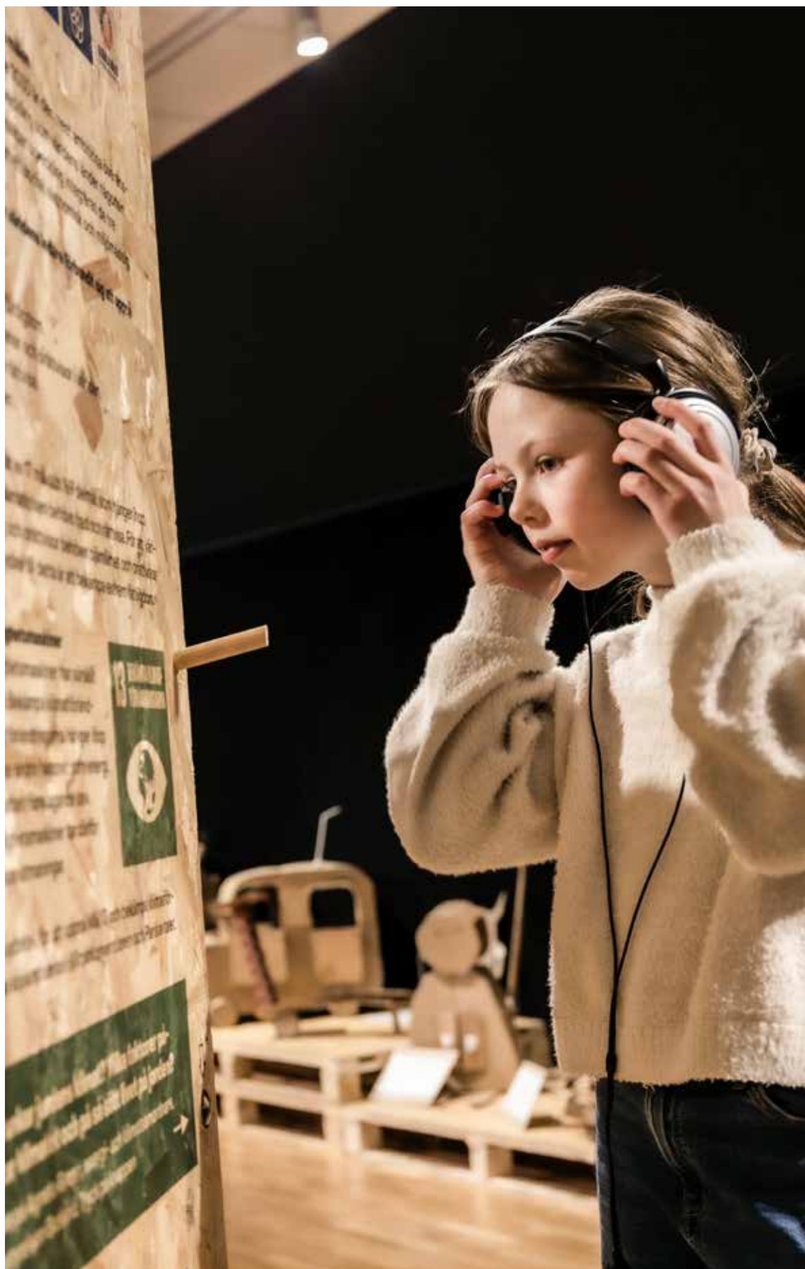
UTSTÄLLNINGEN MÖJLIGHETSMASKINER (2023)