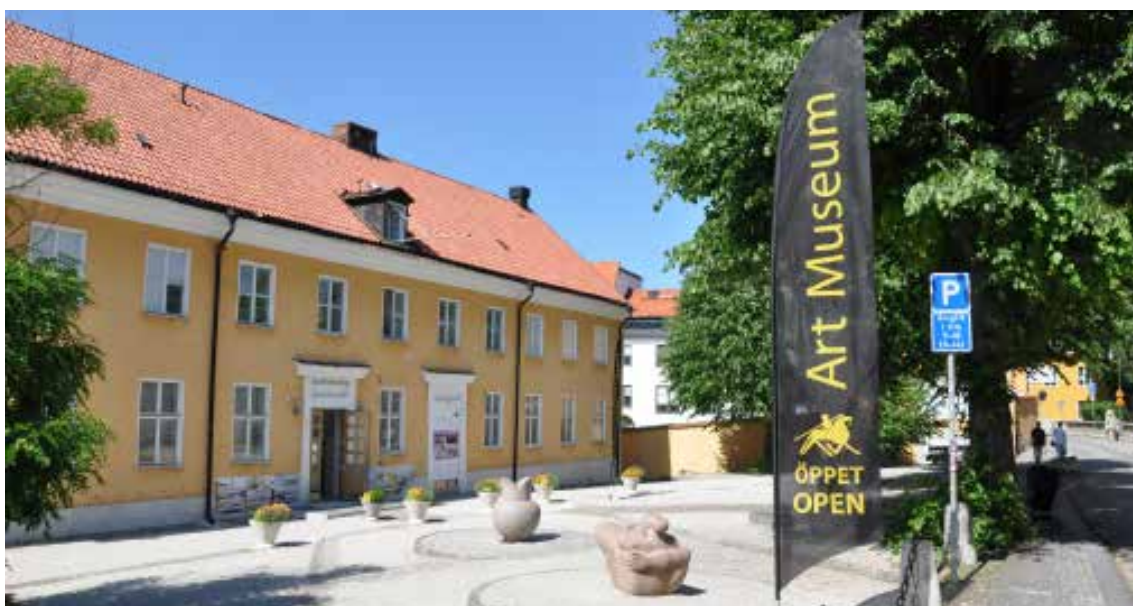
GOTLANDS KONSTMUSEUM.

Gotlands Museum har med hjälp av teknikonsultföretaget SWECO utfört en förstudie angående konstmuseiverksamhetens fysiska placering. Därefter har Gotlands Museum fastslagit att man vill fortsätta bedriva konstmuseiverksamhet i de befintliga lokalerna på Sankt Hansgatan. En programhandling, som innebär en beskrivning hur lokalerna behöver anpassas till verksamhetens behov är framtagen. Nästa steg är att arbeta med finansiering och projektering av ombyggnaden.