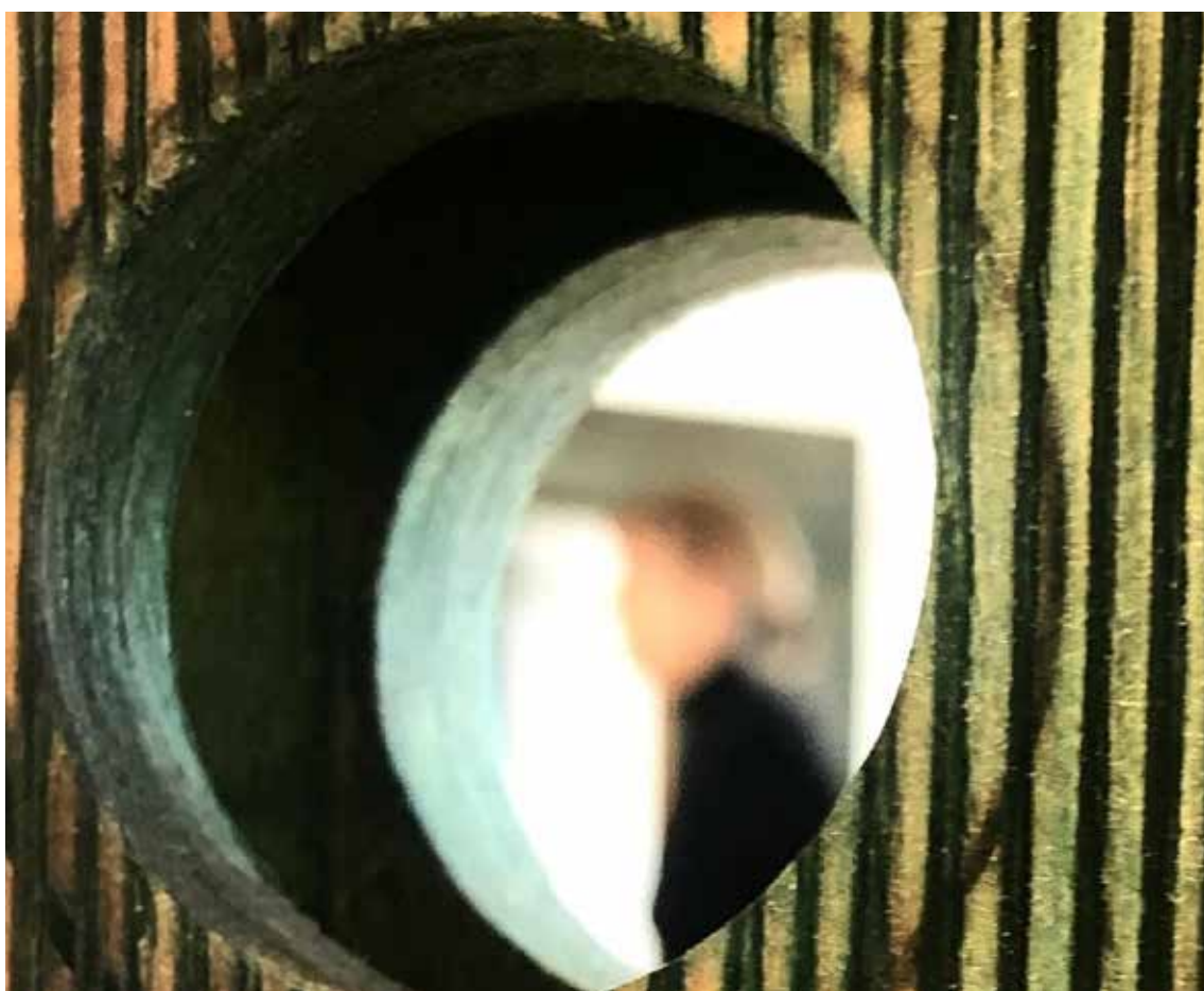
BILD TAGEN I UTSTÄLLNINGEN MELLAN OSS AV JONNA HÄGG

I huset finns personal som arbetar med konst och form samlad, vilket inkluderar verksamhetsansvarig för Konstmuseet, konstpedagogen/konstutvecklaren, slöjd- och formutvecklarna och intendent för offentlig konst. I byggnaden finns också resurscentrum representerat som bidrar till delaktighet med det lokala konstlivet.