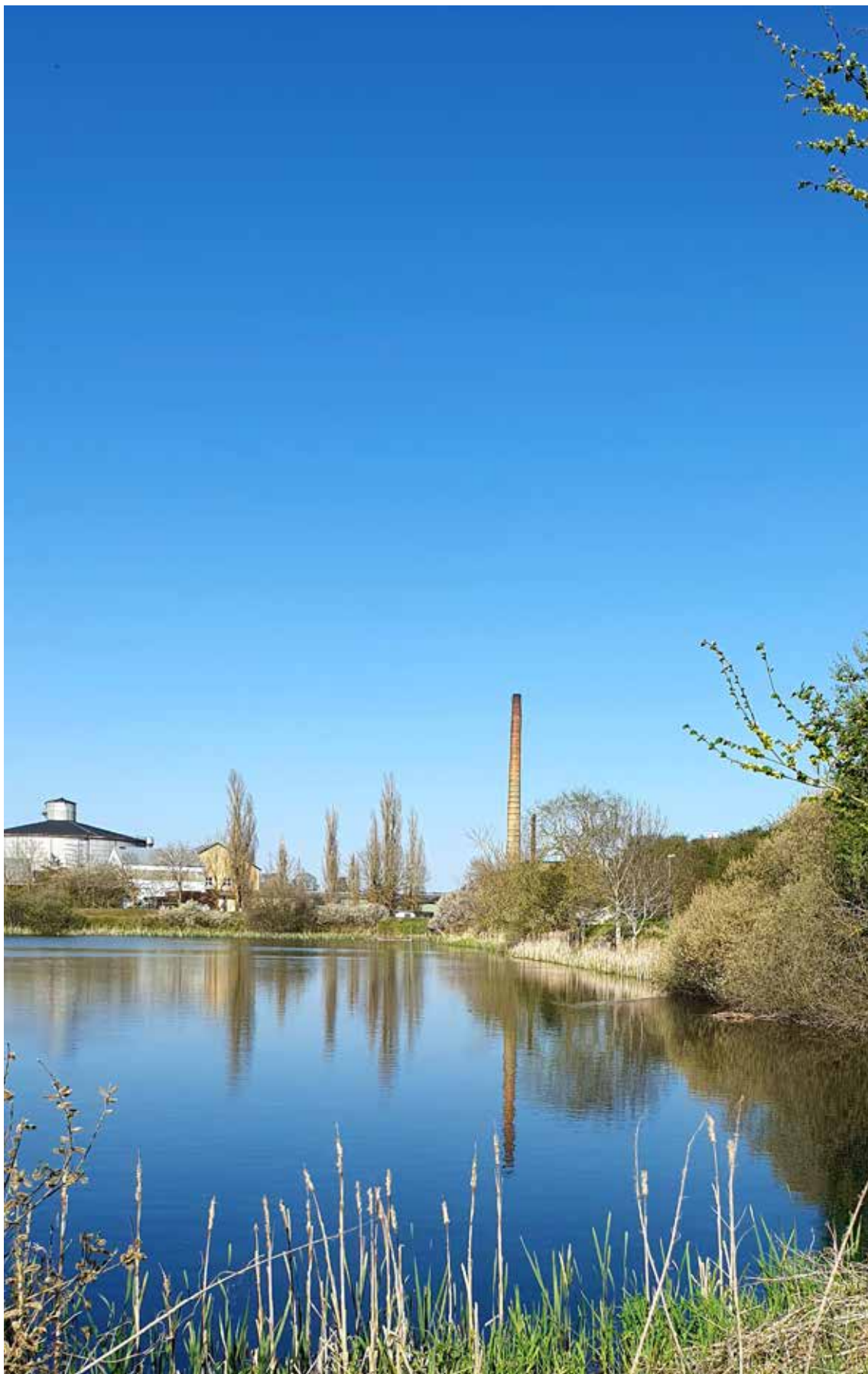
KALLE BROLIN JAG ÄR BAKLÄNGES OCH SPEGLVÄND DUB (2023)